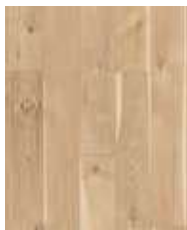
R089 HS Bluetrail