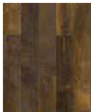
R090 SO Castlebridge