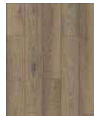
R076 SO Bourbon Cask