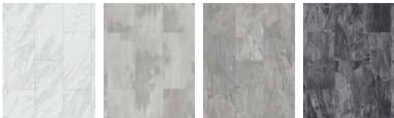
R095 PT Venato