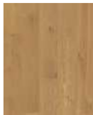
R081 HS Crescendo