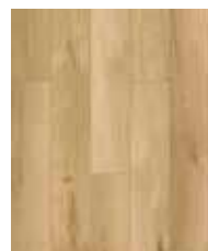
R073 HS Scandipure