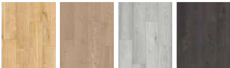
R066 HS Sculpta