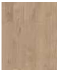
R065 HS Rope