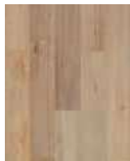
R067 HS Millwood