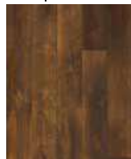
R070 SO Incando