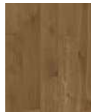
R082 SO Humidor