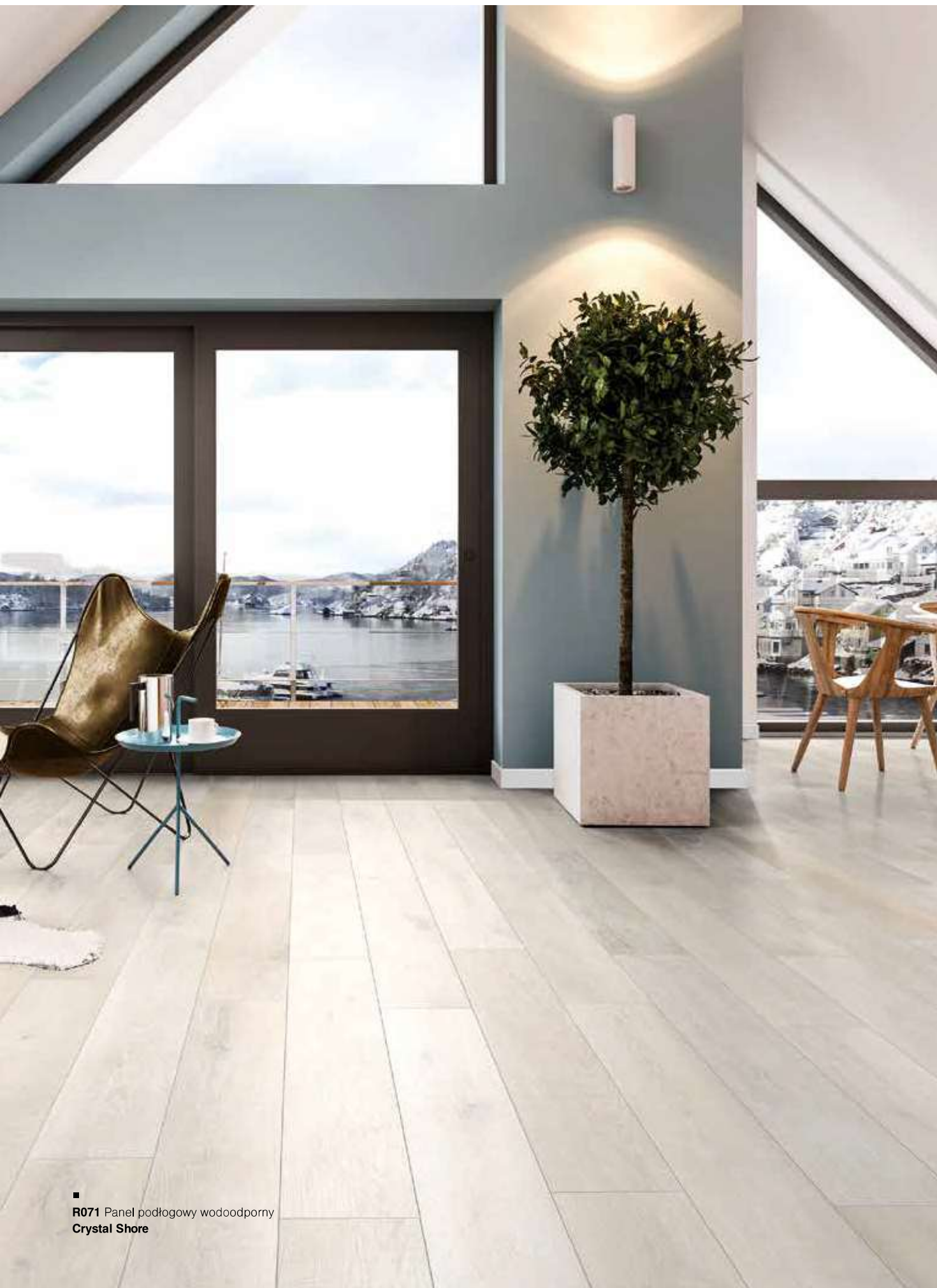
■ R071 Panel podłogowy wodoodporny Crystal Shore