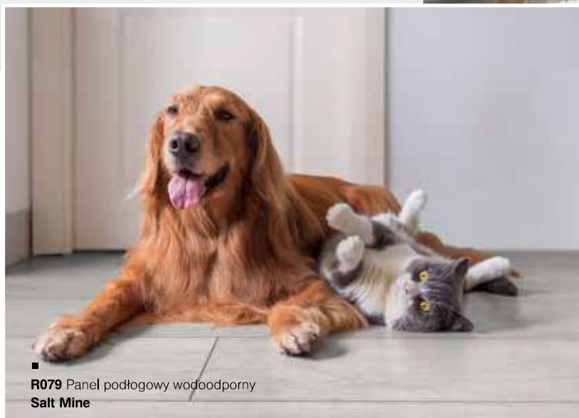
■ R079 Panel podłogowy wodoodporny Salt Mine