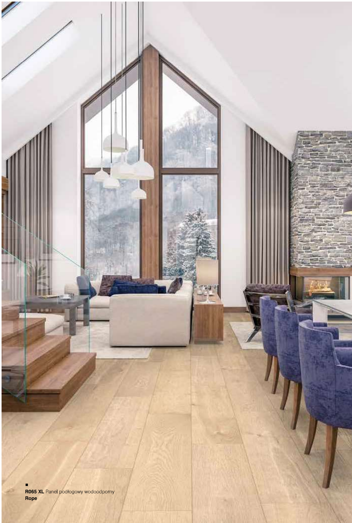
■ R065 XL Panel podłogowy wodoodporny Rope