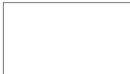
2453L Casa Blanca (WEFA-418736)