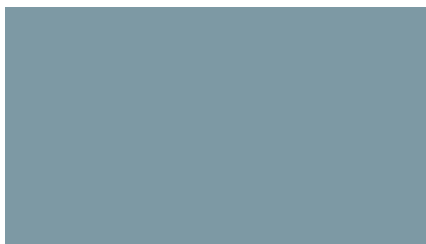
4246/4246 Zielony (WEFA-422234)